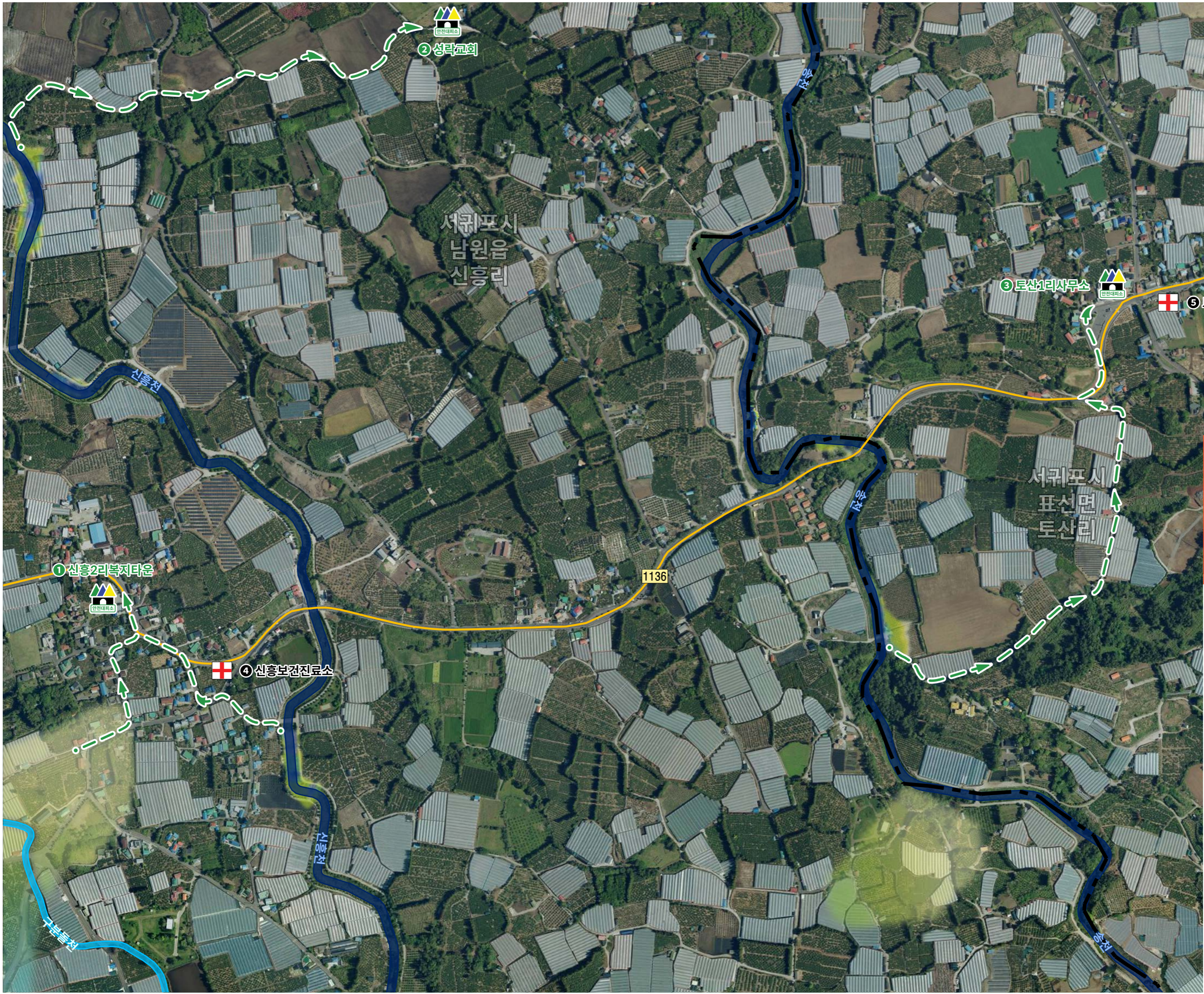
그림 51. 알기 쉬운 재해정보지도 51 남원읍 신흥리 표선면 토산리