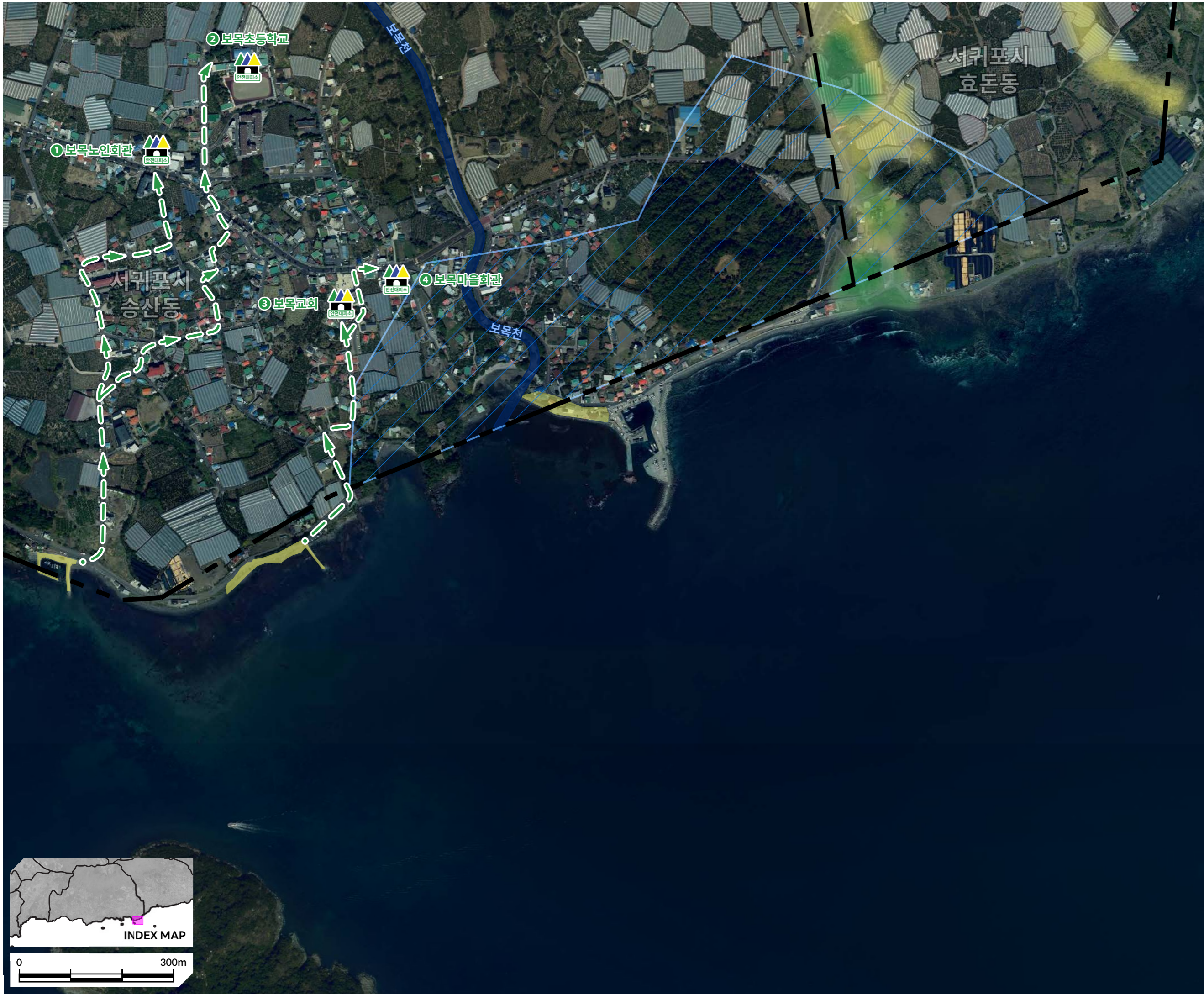
그림 알기 쉬운 재해정보지도 30