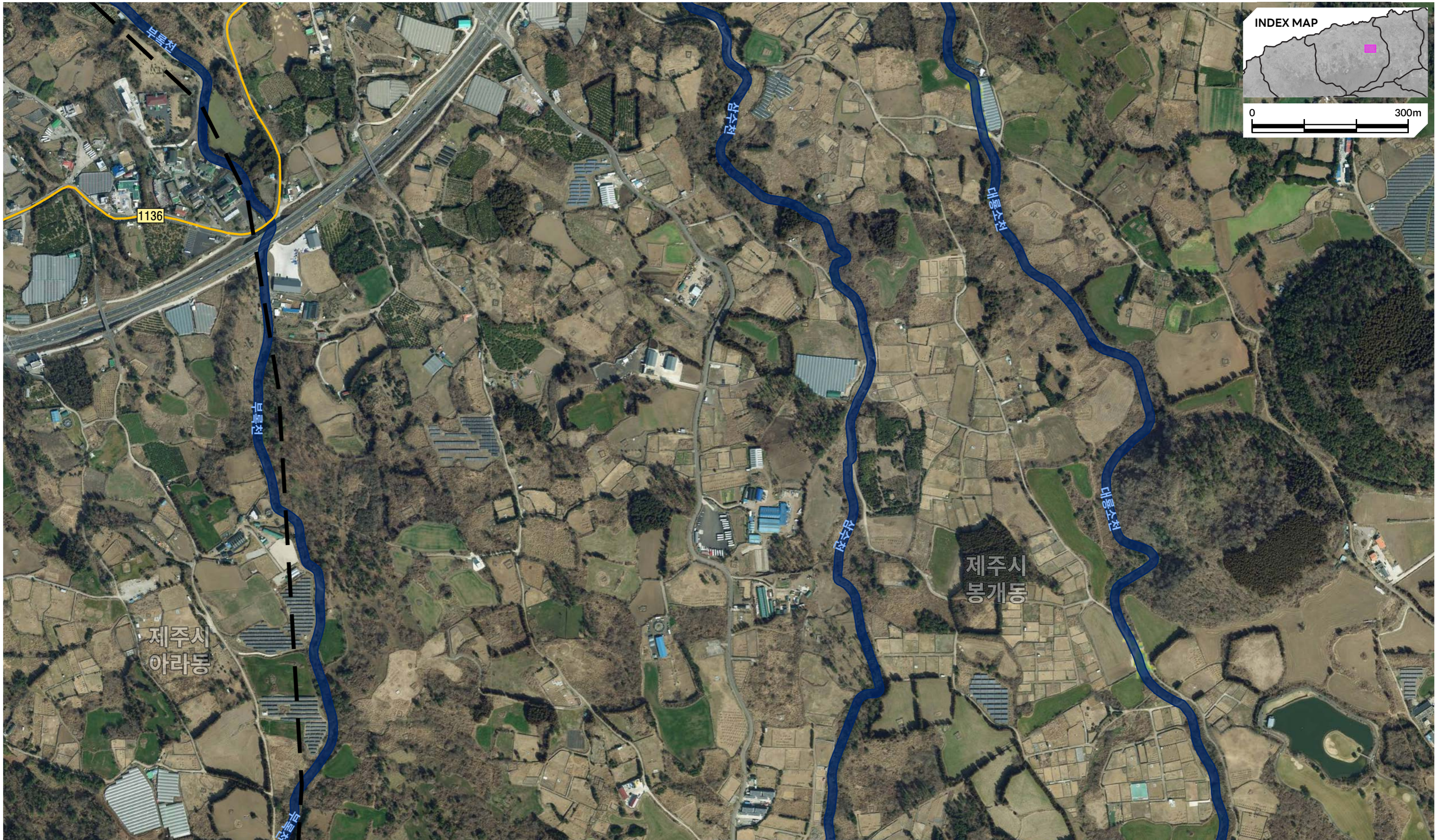
그림 47 알기 쉬운 재해정보지도 47