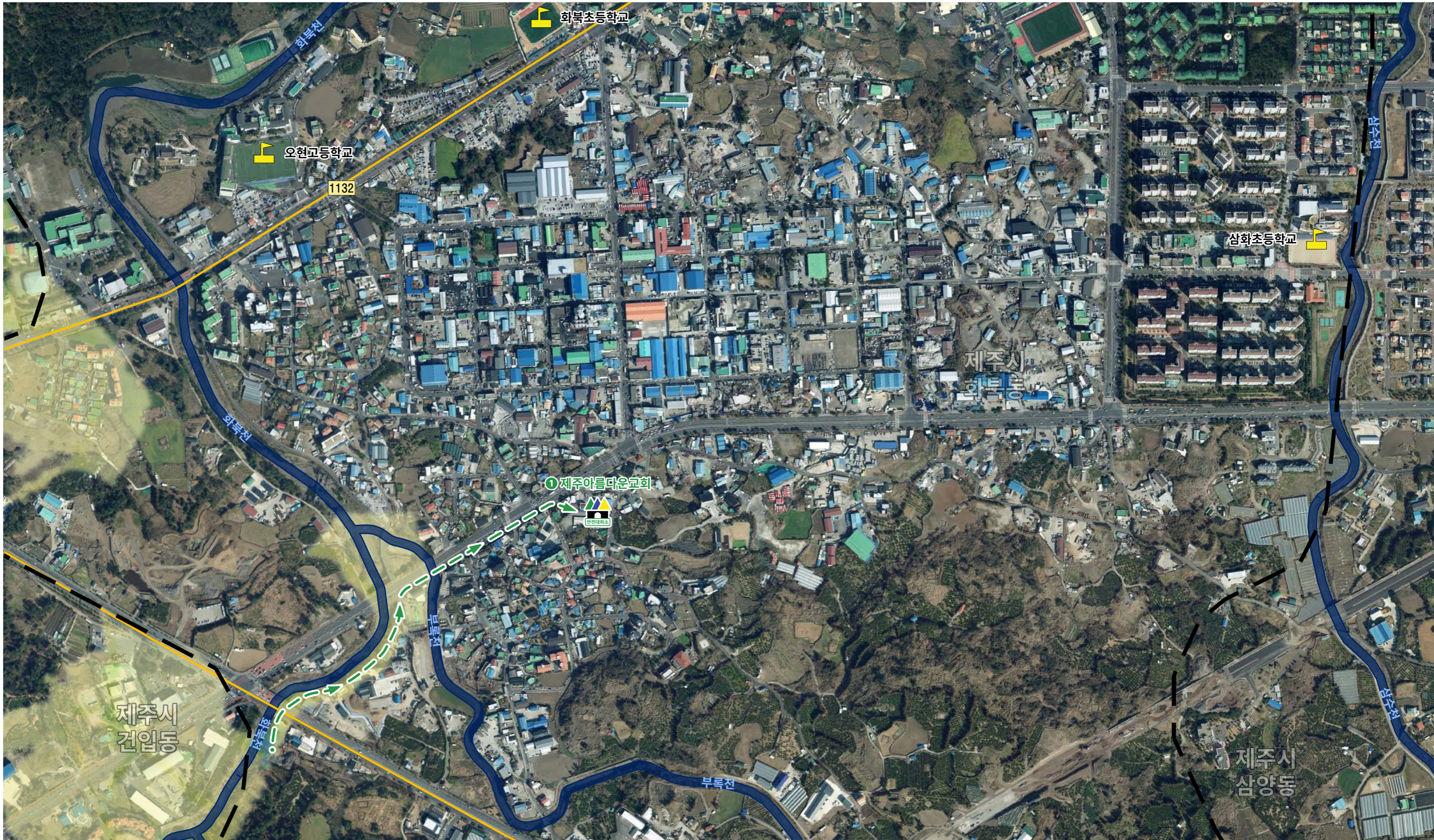
그림 3 알기 쉬운 재해정보지도 43